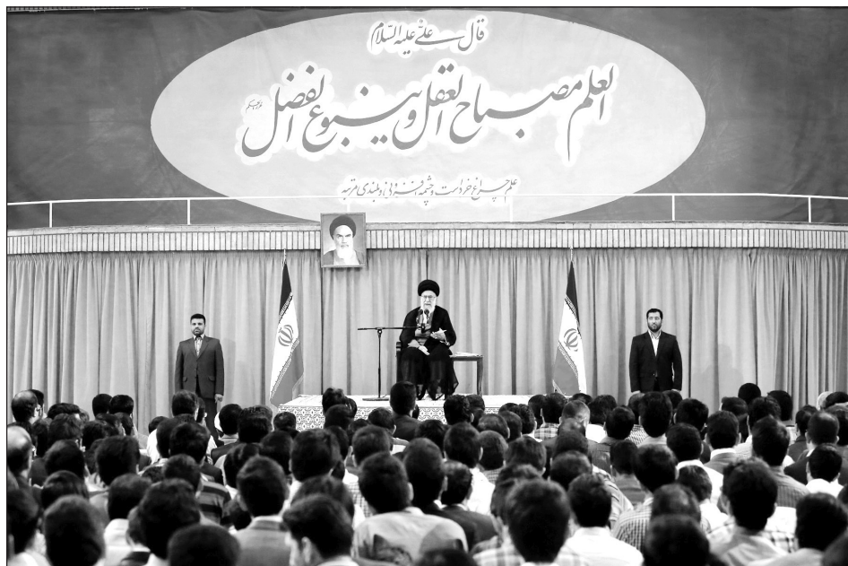
امروز هر کار علمی و فناوری در کشور که زیرساخت آن وجود داشته باشد، از دست جوان ایرانی و نخبه ایرانی بر می آید.

اگر چنانچه از درون نبود و دیگران آمدند، اعتبار به دست نمی آید. در زمان رژیم طاغوت خود فرنگی ها و غربی ها آماده بودند که برخی از کارهای مربوط به فناوری هسته ای را در کشور انجام بدهند؛ قرارداد می بستند. فرض بفرمایید نیروگاه بوشهر را که ما با این همه زحمت بعد از سال ها به دست آوردیم، بنا بود آلمان ها بسازند - [که] پولش را هم گرفتند، بالا هم کشیدند، جوابی هم ندادند بعد از انقلاب - فرض کنید یک نیروگاه هسته ای هم فلان کشور غربی بیاید اینجا، خودش بسازد، خودش اداره کند، از برقش ما استفاده کنیم. این هیچ وزانتی برای یک ملت محسوب نمی شود؛ هیچ ارزشی به حساب نمی آید. آن وقتی اعتبار و وزانت برای یک کشور به وجود می آید که خودش توانایی از خود بروز بدهد. این توانایی وقتی در شما پیدا شد، آن وقت می توانید در شرایط برابر، از توانایی های دیگران هم استفاده کنید، همچنان که آنها از توانایی های شما استفاده خواهند کرد. درست گفتند یکی از دوستان، بدیهی است که یک کشور همه فصول و سطوح مورد نیاز در مسائل علمی و فناوری را نمی تواند خودش تهیه کند، باید از دیگران هم بگیرد؛ اما این گرفتن از دیگران به صورت دست دراز کردن به سوی دیگران نیست؛ به صورت معامله برابر و پایاپای [است]؛ علم می دهید، علم می گیرید؛ فناوری می دهید، فناوری می گیرید؛ احترامتان هم در دنیا محفوظ است. این لازم است.